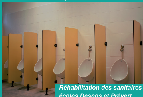
Réhabilitation des sanitaires écoles Desnos et Prévert

Changement de la porte d'accès côté NORD avec intégration visiophone et digicode - Aménagement d'un local de stockage pour le matériel de sport de l'école - Pose d'une clôture et d'un portillon pour création du parc à vélo.